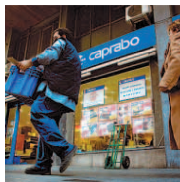
Establecimiento de Caprabo