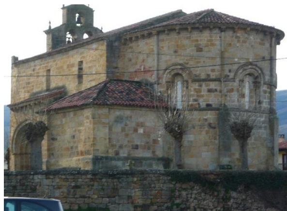
Iglesia de San Facundo y Primitivo (Silió)